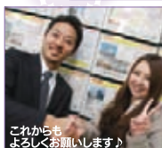
これからもよろしくお願ひします!