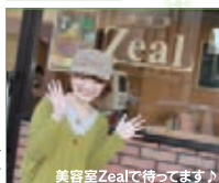
美容室Zealで待ってます!

周囲の人たちが本当に一生懸命に応援して下さい、皆さんの優しさになれることができて、本当に嬉しかったです。所属しているソフトボールのチームの人たちや、家族、友人たちをはじめ、こんなに多くの人たちが協力してくれるんだと、驚きましたし、感謝しています。ファイナルに進むことができたのも、こうした人のつながりのおかげです。今回の選挙を通じて、人のつながりの素晴らしさを改めて感じました。これからも、もっと皆でつながれると良いな、と思っています。また、美容室Zealを宜しくお願いします!