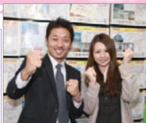
ガッツポーズの堀越さんと社長さん