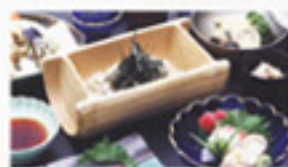
▲一番人気の「相田みつをオススメ御膳」