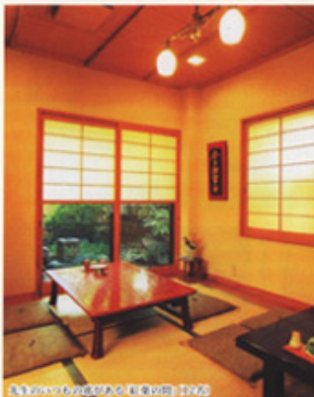
人気のいつもの席がある「紅葉の間」2F2F